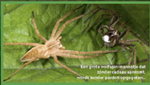
Een grote wolfspin-mannetje dat zonder cadeau aanblijft, wordt zonder pardon opgegeten...