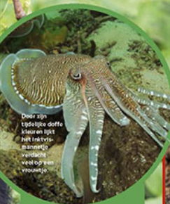
Door zijn tijdelijke doffe kleuren lijkt het inktvis-mannetje vandaan te verdwijnen op een vrouwtje.