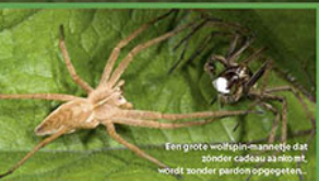
Een grote wolfspin-mannetje dat zonder cadeau aan het rolt, wordt zonder pardon opgegeten...