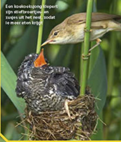
Een koekeekjonge stepert zijn uitbroeitjes en tuisjes uit het nest, zodat te meer eten krijgt.

Een koekeek moeder broedt haar eigen eieren niet uit, maar laat dat andere vogels doen. Zo legt ze haar ei in het nest van een stel zangvogels. De vaders zonder dat ze het weten adoptieouders. Pa en ma hebben zelfs riet door als er een enorm kuiken uit het ei kruipt! Ze voeden het netjes op, terwijl ma koekeek dezelfde truc ergens anders opnieuw uithaalt.